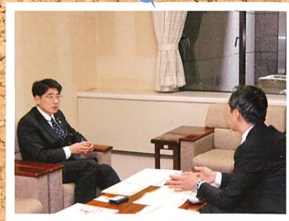
三重県津市で新大規模体育施設建設の状況を聞く