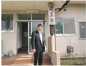
県立朝日学園にて

県立朝日学園は児童自立支援施設として昭和28年に大江町に移転開設しました。様々な家庭環境や生活指導が必要な県内の児童・生徒が入所しています。昨年度より7名の教員で大江町立左沢小学校と中学校の藤田の丘分校として教育施設となり、10名が在籍(5月視察時点)しております(高校生1名を含む)。少人数での環境であり教育施設は昭和49年 蔵王寮、葉山寮は昭和42年建設で早期の改築が求められており適切な環境整備について今後取り組んで参ります。