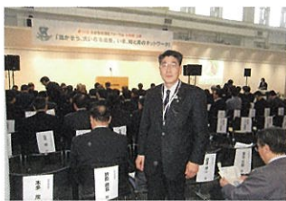
秋田市で開催の北前船フォーラムにて

秋田市土崎で開催された北前船寄港地フォーラムに参加しました。会場では観光庁の映像資料では全国の町おこしの報告中陽市赤湯温泉のワインと食(餅)の報告がありました。また県外から秋田の大学に在籍している学生の視点での地域の魅力発掘や過疎地域の活性化に取り組んでいる模様が報告され、視点を変えた地域資源を見直す大切さを考えさせられました。また女性の視点も大切で、女性力が今後大きな力になることを改めて感じました。