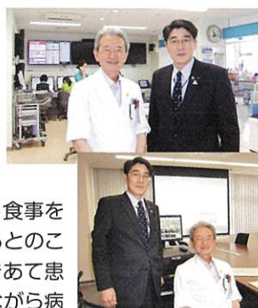
高知県 近森病院院長と

昨年12月にNHK「おはよう日本」で取り上げられた高知市の社会医療法人近森病院を訪問。10年前からこの病院の管理栄養士数は全国平均3倍の22名です。特に高齢者は術後の点滴だけの栄養補給だけでは低栄養になるケースが患者の45%と多いことの経験から、早い段階で口から食事をとることが早期退院に結びついているとのこと。病院の管理栄養士は自ら聴診器をあて患者のお腹の状態を見て医師と相談しながら病棟の医療専門職として働いております。本県では本年4月より管理栄養士を育成する米沢栄養大学を設立し40名の学生が入学しました。この管理栄養士が近森病院のような取組が出来ればと思います。将来、管理栄養士が病棟で活躍する日を期待したいと思います。