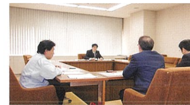
高知県の東京オリンピック合宿招致活動を視察