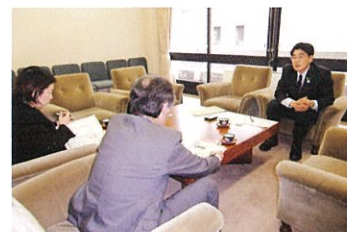
三重県の日本・台湾交流の状況を視察