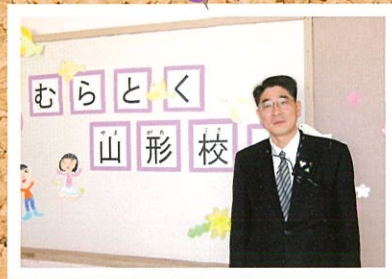
村山特別支援学校山形校開校式会場にて