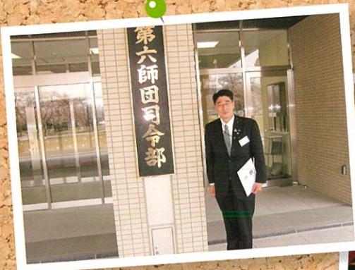
自衛隊神町駐屯地前にて