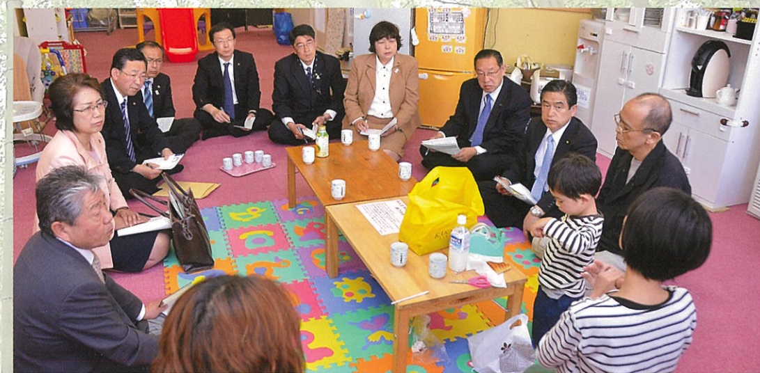
米沢市で福島からの避難者との意見交換を行う