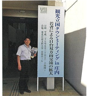
観光立国タウンミーティング in 庄内会場にて

知事 山形県での開催が東北の本格的なインバウンド時代の到来を告げる象徴的な場面となった。日台相互交流500万人の実現には、地方分散や、季節分散と広域観光の推進、若い世代の交流や観光業界・行政等における人材交流を日台双方で積極的に推進していくことが議長総括として合意された。また多くの台湾メディアが参加し、台湾でも大きく報道され、山形県の認知度が大きく向上した。民間の動きでは、チャーター便を活用した相互交流を実施するとの意向が表明されるなど、インバウンド観光を推進する好機だと捉えている。