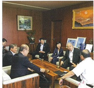
訪日観光客の増加等について副知事と意見交換

商工労働観光部長 大使館との連携では昨年度、在シンガポール日本大使館の協力のもと、現地の関係各界の要人を招待しました夕食会で、つや姫や山形牛など県産品を使用した料理を提供し、知事がトップセールスを行っている。今後も現地の日本大使館と連携して、本県の食と観光を一体的にアピールしたい。国内にある各国の大使館への働きかけは今後頑張って勉強してまいりたい。在日の各国大使館へは、知事が先頭に立って、PRをさせていただいている。