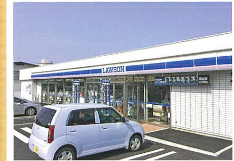
地域資源として期待されるコンビニエンスストア