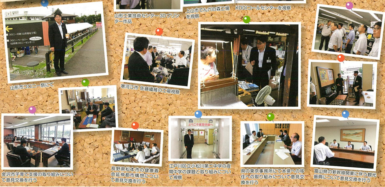
南陽市 山形食品工場を視察 山形工業技術センター3Dプリンター作品 上山市でん六の森工場 KDDIコールセンターを視察 山形市コロニー祭にて 寒河江市 佐藤繊維の工場視察 金沢市子育て支援の取り組みについて意見交換を行う 長野県松本市の健康寿命延伸都市構想について意見交換を行う 江戸川区立小松川第三中学の夜間中学の課題と取り組みについて視察 県の東京事務所にて本県への移住への取り組みについて意見交換を行う 富山県の新幹線開業に伴う観光振興について意見交換を行う