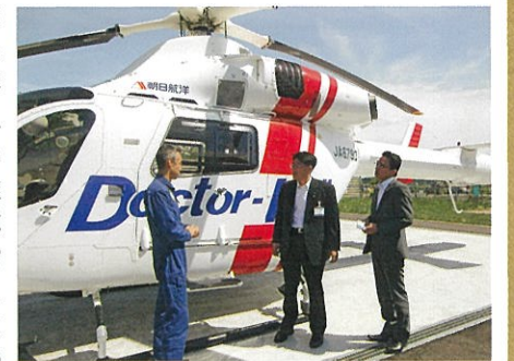
秋田県のドクターヘリ運航状況を視察

健康福祉部長 本県のドクターヘリの出動実績は、平成24年11月の運航開始以来、平成27年3月末までの件数は690件と、年々増加傾向にある。今後も、隣県との広域連携による支援体制の充実等により出動件数の増加が見込まれる。ドクターヘリの運航に要する経費に係る部分ではヘリコプターの賃借料や燃料費、さらにフライトドクターやフライトナースの人件費などの運航経費で、国庫補助制度が2分の1となっているが、政府の予算の都合上、現在七割程度に圧縮されている状況であり導入当初の想定を上回る県の負担が生じている。26年度は約2億1600万円の事業計画に対し、国庫内示額が補助上限額1億800万円の約67%の約7300万円で、不足する約3500万円分は県の追加負担である。県といたしましても、県議会とともに、平成28年度政府の施策等に対する提案で、ドクターヘリ運航に係る支援の拡充を求めている。ドクターヘリは、一人でも多くの県民の命と暮らしを守るため、県内の救急医療体制の構築に欠かせないものであり、運航に支障が生じることのないよう、あらゆる機会を通じ、政府に対し粘り強く働きかけを行って参りたい。