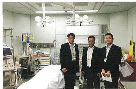
松本市相澤病院の経営改革について視察

病院事業管理者 県立病院は、高齢化時代への対応と、時代が求める医療ニーズに応え、病院の立地する地域の実情などから病院の機能を転換してきた。地域医療構想は一見ピンチに見えるが、チャンスと捉えている。河北病院では急性期の機能を残しつつ一病棟を回復期の機能を持つ地域包括ケア病棟に転換。緩和ケア病棟を開設した。県立病院といたしましては、地域医療構想にいち早く対応するとともに、医師確保や健全経営の取り組みも推進し、県民に安心・信頼・高度の医療を提供し、県民医療を守り支えていく。