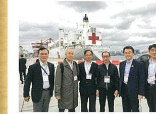
東京湾で病院船「マーシー」を視察

米国海軍所属病院船「マーシー」が東京湾に初寄港しました。病院船はこれまで海外での津波や地震などの大規模災害時に活躍しています。