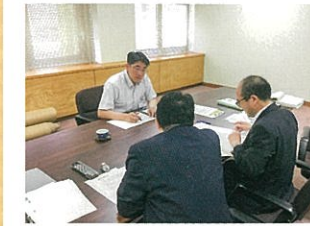
秋田県庁で「貨客混載事業」の現状と課題について意見交換を行う

人口減少で利用者数の少ないバス路線の確保と物流の人手不足を一緒に解決しようと「貨客混載」事業を行っている秋田県を訪問。路線バスの空き席に荷物を載せて、終点から物流業者へ届ける取組みです。