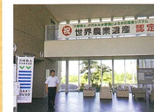
宮城県大崎市で「世界農業遺産」認定の取組みと今後の展開について意見交換を行う

宮城県大崎市では「大崎耕土」が世界農業遺産の認定になりました。厳しい環境の中で知恵を出し、助け合い支え合ってきた地域の伝統や文化を形成してきたことが評価につながったとの事です。