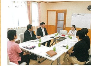
医療的ケアを要する子どもの支援策について山形市内で意見交換を行う

放課後等デイサービス事業所「まなびのへや バンビーナ」で、利用している保護者からは行政の理解促進と、支援の充実と課題についてのお話を伺いました。この事業所では医療的ケアを要する子どもへの支援を行っています。