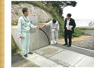
南三陸町で津波等での浸水を食い止める「自立式フラップゲート」の設置状況を確認

宮城県南三陸町では津波や高潮時に海水流入を電源がなくても自動で浮き上がる水門を導入。水が入り始めるとフラップゲートが自動で浮き上がるので、電源が要らず、これまでの水門のようにスイッチを押す人も要りません。