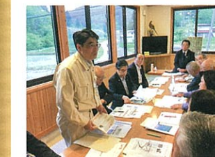
山辺町作谷沢地区で人口減少と地域活性化についての意見交換を行う

山辺町作谷沢地区の活性化について意見交換を行いました。人口減少や少子化などの課題がありますが交流人口増加が必要です。