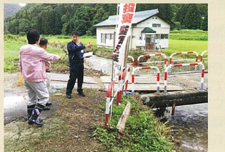
尾花沢市岩谷沢地区の橋梁被害の状況を調査