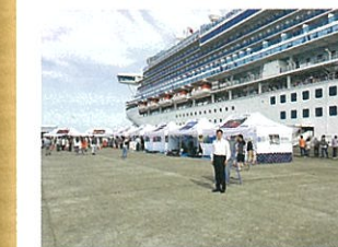
酒田港にて外航クルーズ船受け入れ状況を調査

英国船籍外航クルーズ船「ダイヤモンドプリンセス」が酒田港に寄港しました。全国的にクルーズ船の誘致に取組んでおり東北では青森港には20隻以上寄港しています。