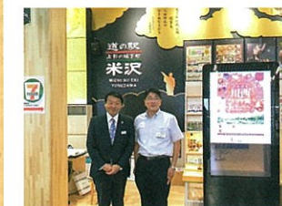
「道の駅よねざわ」での入り込み状況とインバウンドへの対応について意見交換を行う

「道の駅 米沢」がオープンし利用者数が100万人を超えました。東北中央自動車道栗子トンネル開通効果と置賜地域の伝統・文化の発信が功を奏しています。