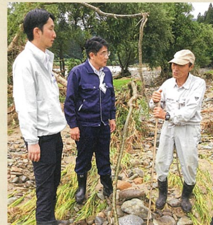
最上町長沢地区で河川堤防決壊による田畑への土石流入被害から農業再生産への要望を聞く