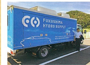
福島市飯坂町で移動型水素ステーションの取組みを調査

福島県飯坂町で商用ベースでは日本初となる再生可能エネルギーを利用した移動式水素ステーション「ふくしまハイドロサプライ(株)」の供給状況を確認しました。